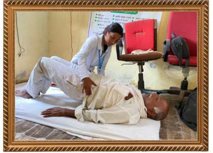
हर घर आयुर्वेद उपक्रमांतर्गत ग्रामीण भागामध्ये प.पू.गुरुमाऊली आण्णासाहेब मोरे आयुर्वेद कॉलेज व गुरुकृपा कॉलेज ऑफ फिजिओथेरेपी याच्या संयुक्त विद्यमाने सतत वर्षभर आरोग्य प्रबोधनपर शिबीर आयोजित केली जातात.