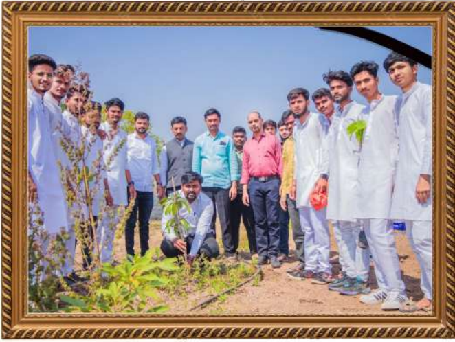
गुरुकृपा ग्रुप ऑफ इन्स्टिट्यूटस् मधील संत श्री सेवालाल महाराज जयंती निमित्त वृक्षारोपण करण्यात आले.