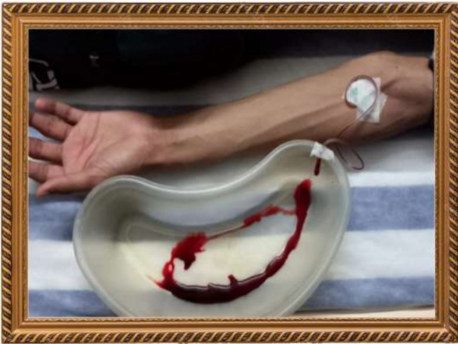
प. पू. गुरुमाऊली अण्णासाहेब मोरे आयुर्वेद कॉलेज व हॉस्पिटल, माजलगाव येथे पंचकर्मा अंतर्गत रक्तमोक्षण थेरपी करण्यात आली.