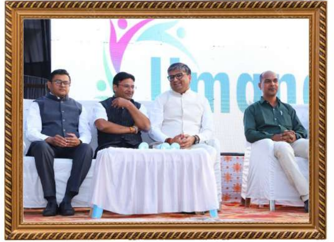
गुरुकृपा ग्रुप ऑफ इन्स्टिट्यूट्स आयोजित उमंग फेस्टिवल मधील उपस्थित मान्यवर