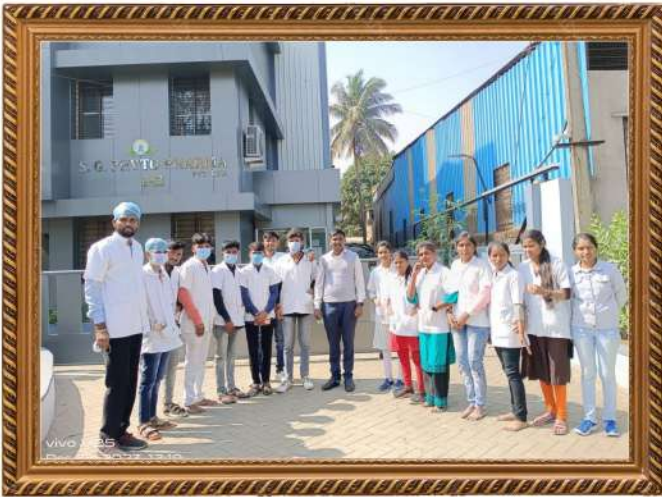
गुरुकृपा इन्स्टिट्यूट्स ऑफ फार्मसी मधील विद्यार्थ्यांची कोल्हापूर येथील नामांकित फार्मास्युटिकल कंपनी S.G.PHYTO PHARMA Pvt.Ltd. येथे भेट देण्यात आली.