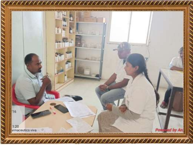
शिक्षकवृंद व विद्यार्थी यांचा सुसंवाद