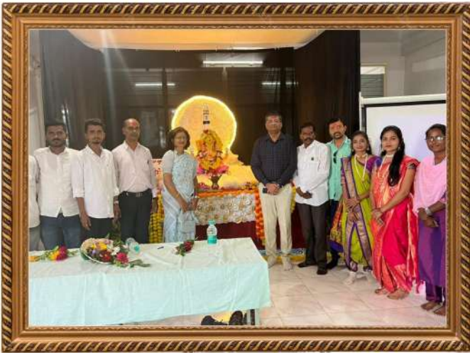
गुरुकृपा ग्रुप ऑफ इन्स्टीट्युटस् मध्ये श्रीची स्थापना