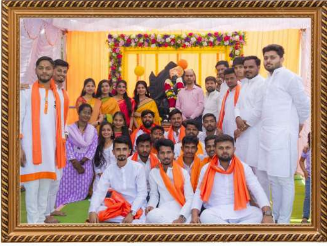
गुरुकृपा ग्रुप ऑफ इन्स्टिट्यूटस् मधील छत्रपती शिवाजी महाराज जयंती मोठ्या जल्लोषात साजरी झाली.