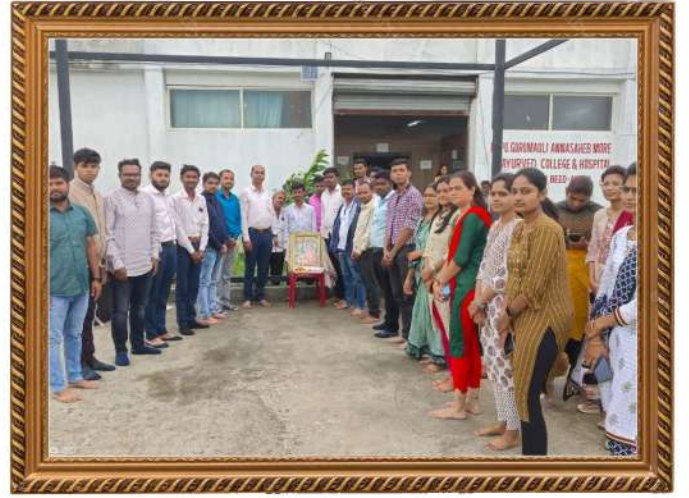
गुरुकृपा इन्स्टिट्यूटस् ऑफ फार्मसी मधील विद्यार्थ्यांनी गोकुळाष्टमी मोठ्या आनंदात साजरी केली.