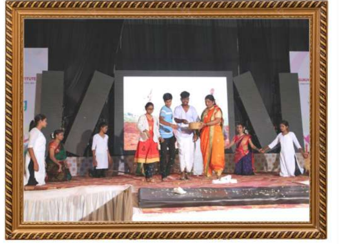
गुरुकृपा ग्रुप ऑफ इंस्टिट्यूट्स आयोजित उमंग फेस्टिवल मधील काही क्षण