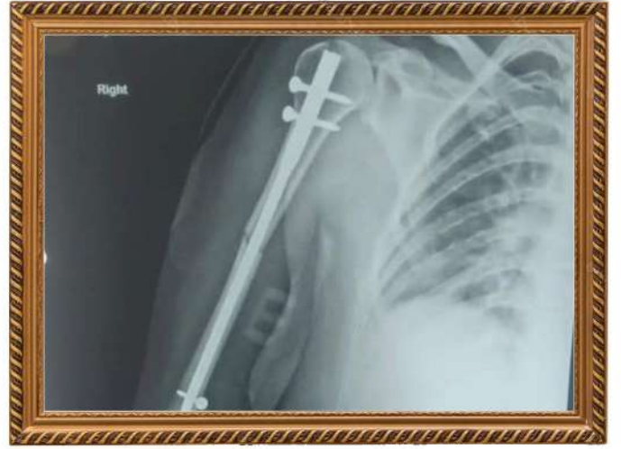
जीवनदायी योजनेअंतर्गत हाडाची शस्त्रक्रिया यशस्वी रित्या पुर्ण करण्यात आली.