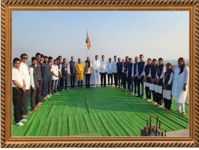
गुरुकृपा ग्रुप ऑफ इन्स्टिट्यूट्स मध्ये प्रजासत्ताक दिनानिमित्त ध्वजारोहन प्रसंगी उपस्थित मान्यवर