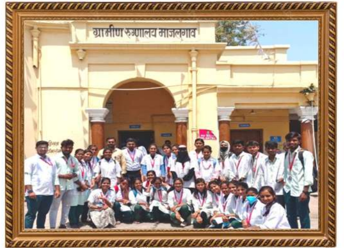
गुरुकृपा इन्स्टिट्यूट्स ऑफ फार्मसी महाविद्यालयाची ग्रामीण रुग्णालय, माजलगाव येथे शैक्षणिक भेट.