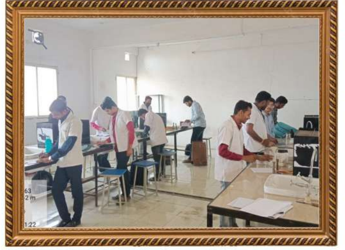
विद्यार्थीवर्ग प्रात्यक्षिक करतांना