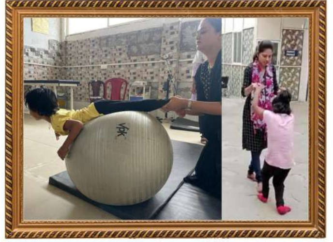
गुरुकृपा ग्रुप ऑफ इन्स्टिट्यूट्स, माजलगाव येथे जन्मजात अपंगत्व असलेल्या बालकास फिजिओथेरेपी द्वारा उपचार देत असतांना तज्ञ डॉक्टर