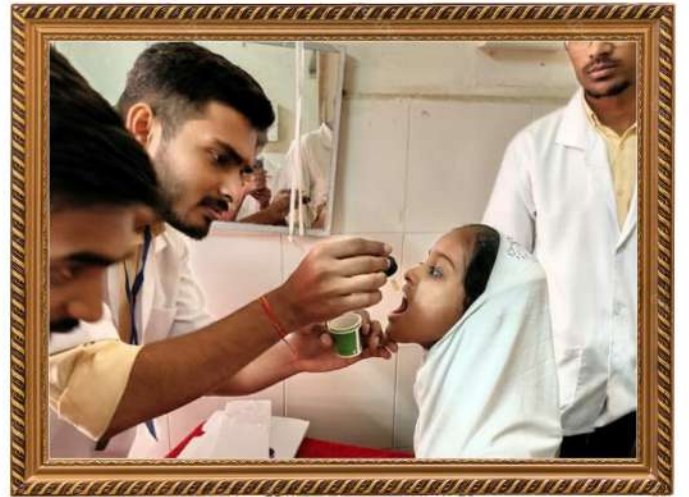
प. पू. गुरुमाऊली अण्णासाहेब मोरे आयुर्वेदिक कॉलेज, माजलगाव मधील विद्यार्थ्यांनी हर घर अभियाना आंतर्गत १२ वर्षांच्या मुलांना सुवर्ण प्राशन देण्यात आले.