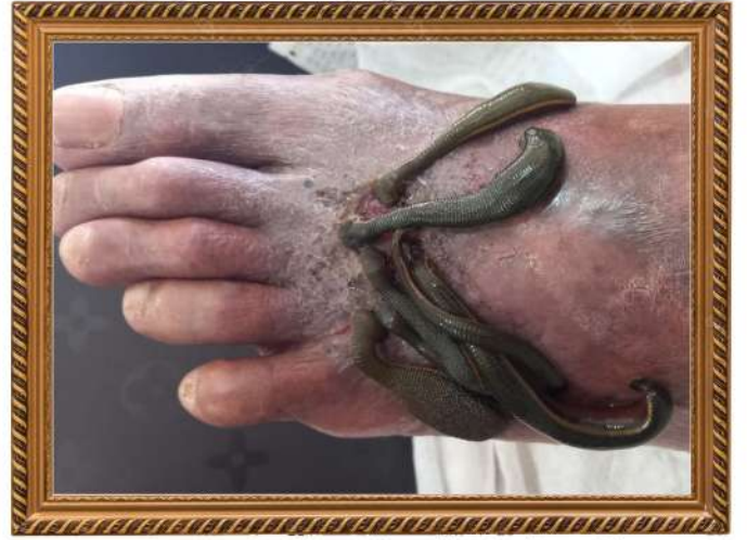
प. पू. गुरुमाऊली अण्णासाहेब मोरे आयुर्वेद कॉलेज व हॉस्पिटल, माजलगाव येथे पंचकर्मा अंतर्गत जलौकावचरण करण्यात आले.