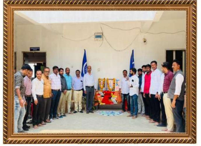
गुरुकृपा ग्रुप ऑफ इन्स्टिट्यूटस् मधील डॉ.बाबासाहेब आंबेडकर जयंती मोठ्या जल्लोषात साजरी झाली.