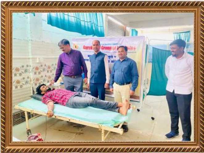
गुरुकृपा ग्रुप ऑफ इन्स्टिट्यूटस् येथे डॉ. बाबासाहेब आंबेडकर जयंती व महात्मा फुले यांचा जयंती निमित्त रक्तदान शिबिराचे आयोजन करण्यात आले