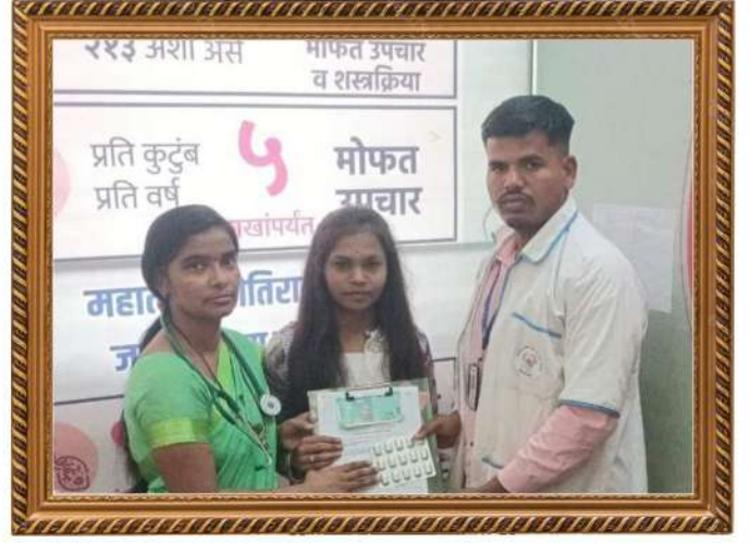
जीवनदायी योजनेअंतर्गत यशस्वी उपचार केल्यानंतर रूग्णास डिस्चार्ज देत असतांना