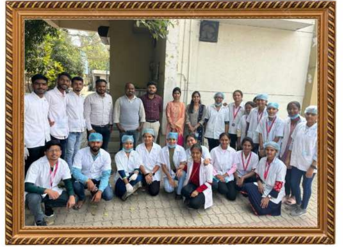
गुरुकृपा इन्स्टिट्यूट्स ऑफ फार्मसी मधील विद्यार्थ्यांची अहमदनगर येथील नामांकित फार्मास्युटिकल कंपनी BORA PHARMACEUTICAL Pvt. Ltd. येथे भेट देण्यात आली. त्यावेळी विद्यार्थ्यांसह सर्व कर्मचारी उपस्थित होते.